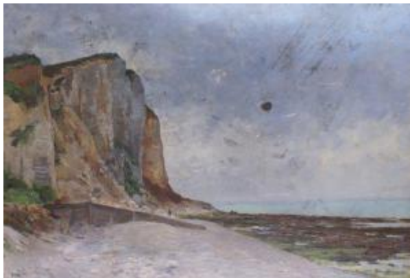
La Falaise à Veulettes de René-Maurice Fath.

A la fin du XIXème siècle, les lecteurs des journaux étaient friands de feuilletons.